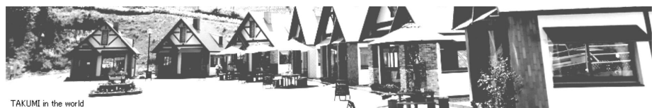
TAKUMI in the world

太陽公園に併設された匠の技の見学コーナーです。一部有料で体験ができるものもあります。