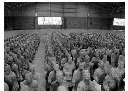
秦始皇帝兵馬俑抗レプリカ

太陽公園は、世界の歴史的建造物や遺構などをミニチュア版に表現する石のテーマパークのように作られています。驚くべきは秦の始皇帝兵馬俑抗のレプリカでしょうか。このスケールの大きさには驚きを隠せません。また長大な万里長城や、ピラミッド、凱旋門、天安門広場、そして圧巻は磨崖仏だといわれます。千里の道も一歩から、石のように固いそんな意志で歩き通して頂きたい施設となっています。