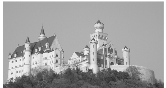
壮大なスケールの白鳥城全景